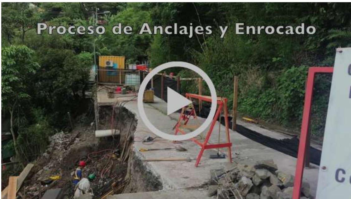
Proyecto Calle Juan Santana

La Municipalidad de Escazú agradece a los vecinos de Juan Santana por su apoyo previo y posterior a la obra.