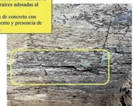
Figura 5 Losa de concreto (superficie inferior).

Arietamiento en 1 y 2 direcciones en elementos de bustón, viga cabezal y alerones. Se evidencia la presencia de raíces adosadas al bustón. Además, losa de concreto con descascaramiento y presencia de eflorescencia.