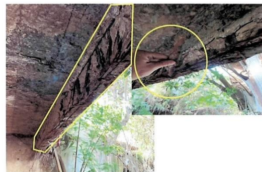
Figura 6 Vigas principales (externa aguas abajo)

Árbol adosado a la fundación la cual se expuesta.