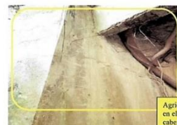
Figura 4 Viga Cabezal y alerones

Arietamiento en 1 y 2 direcciones en elementos de bustón, viga cabezal y alerones. Se evidencia la presencia de raíces adosadas al bustón. Además, losa de concreto con descascaramiento y presencia de eflorescencia.