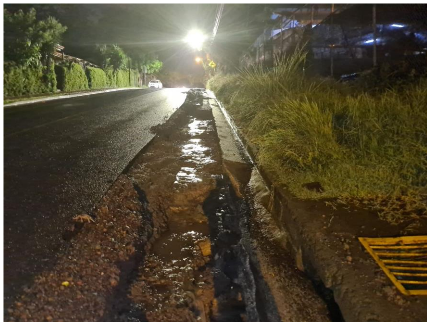
Fotos 8 de junio, donde se atiende el problema por medio de la municipalidad.