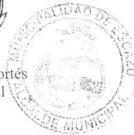
Arnoldo Barahona Cortés Alcalde Municipal