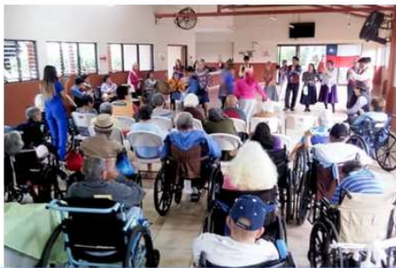
Presentación en Hogar Magdala

Otras: Hogar Santa Clara, Hogar Damas Vicentinas, Sta Teresa , Edificio Pedro Arias, Escuela del Carmen, Hogar San Francisco-Barrio El Maná )