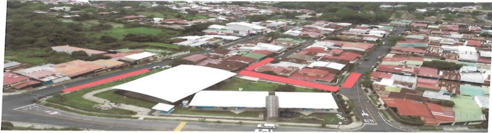
En color rojo se encuentra demarcado las principales áreas afectadas al momento de realizar actividades.